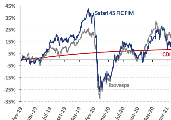
Rentabilidade Acumulada (%)